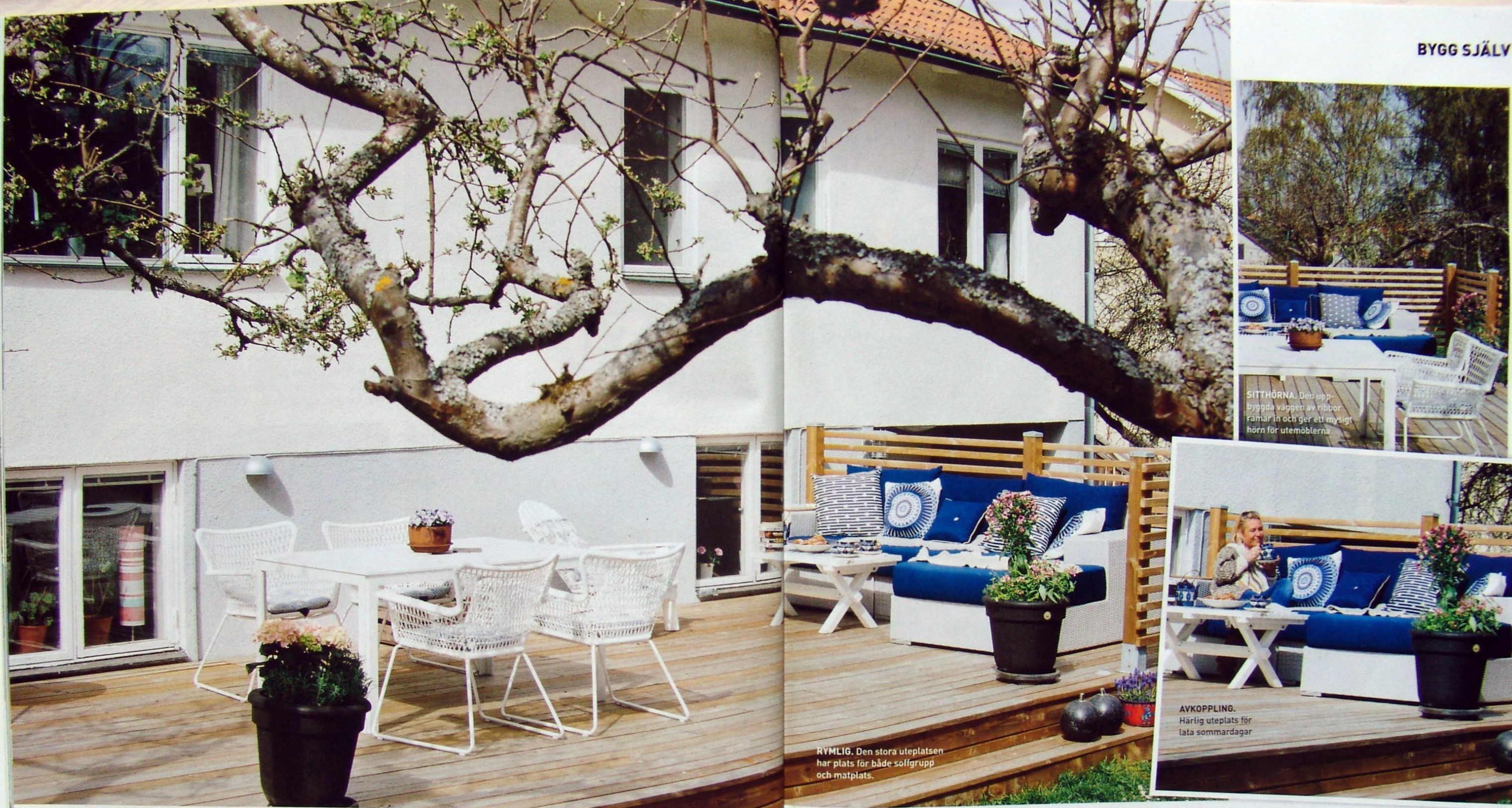
SITTHÖRNA. Den uppbyggda väggen av ribbor ramar in och ger ett mysigt hörn för utemöblerna.